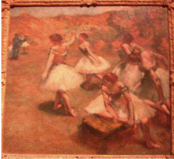
Degas. 1889. Danseuses sur la scène : Musée des Beaux Arts de Lyon