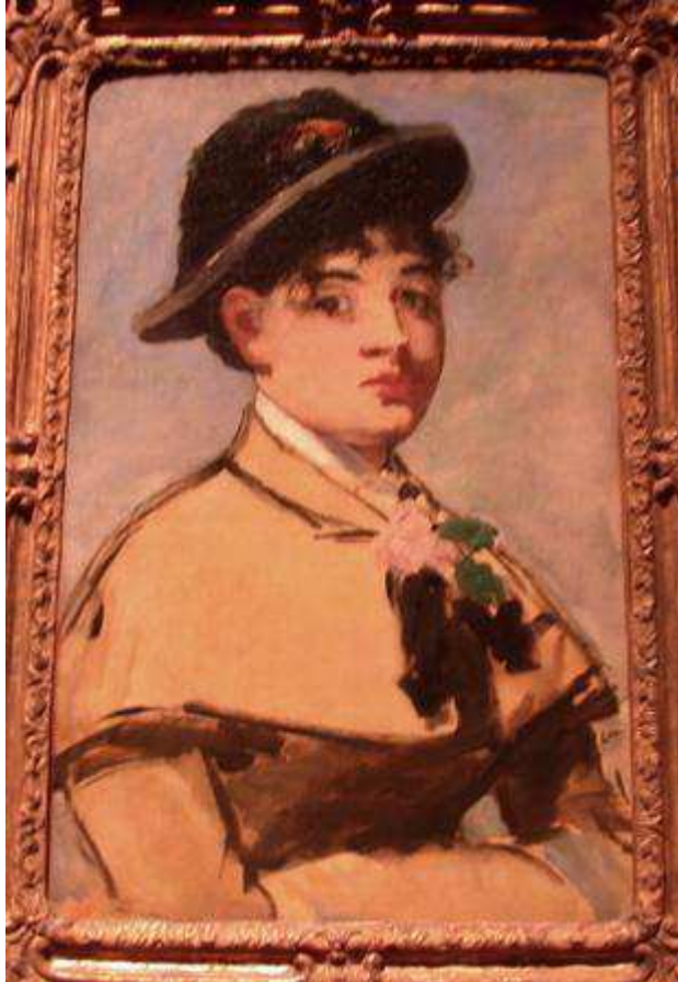
Edouard Manet : Jeune fille à la pélerine 1889 : Musée des Beaux Arts de Lyon