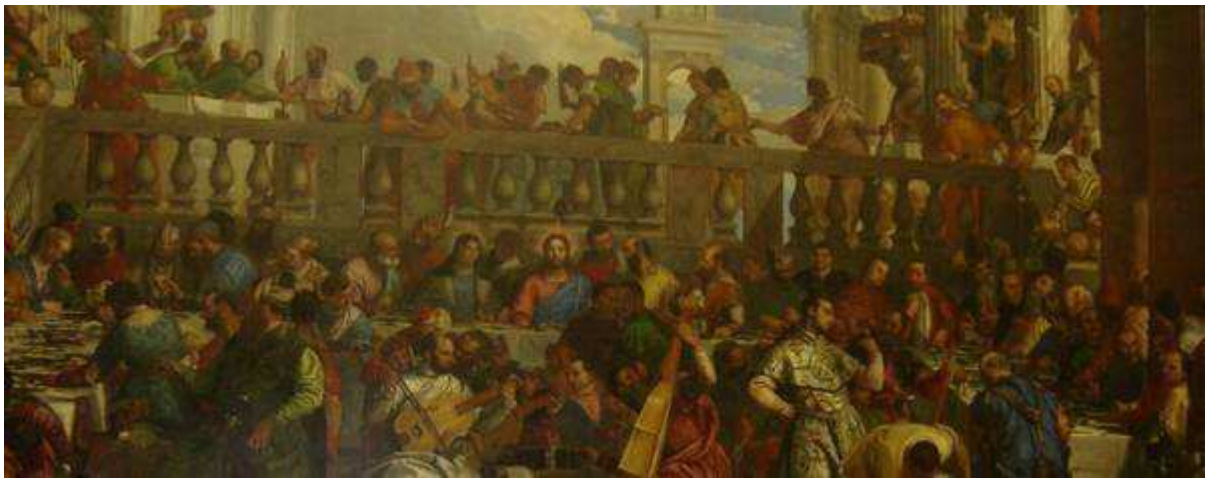
Les noces de Cana (détail) : Véronèse (château de Versailles)

Se définit comme artistique toute activité qui cherche à travers des images à communiquer des sensations, des émotions des sentiments. L'artiste est celui qui cherche à donner une dimension esthétique à son travail.