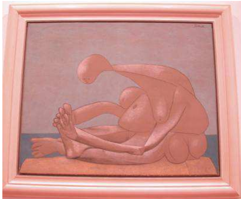
Picasso : femme assise sur la plage 1937. Musée des Beaux Arts de Lyon

Il est nécessaire de maîtriser le vocabulaire de l'art et de la peinture en particulier, voici quelques termes qui vous seront utiles. N'hésitez pas à cliquer pour découvrir des œuvres illustrant les termes techniques. Ces œuvres (ou ces artistes) sont célèbres et doivent constituer pour vous quelques références culturelles précieuses.