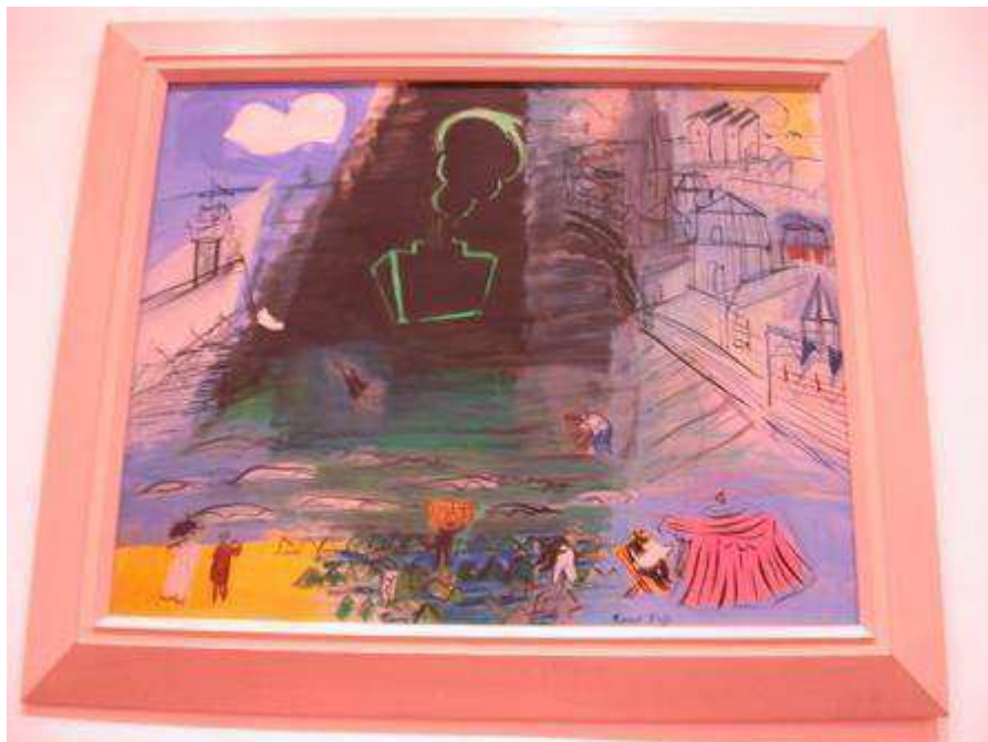
Raoul Dufy. 1952. le cargo noir. Musée des Beaux Arts de Lyon