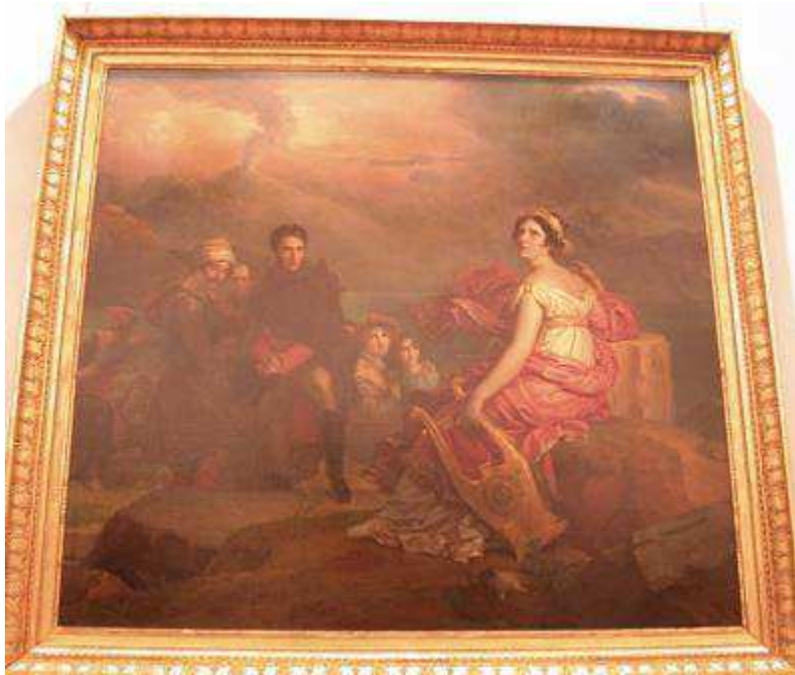
F. Girard : 1819 Corinne au Cap Misère