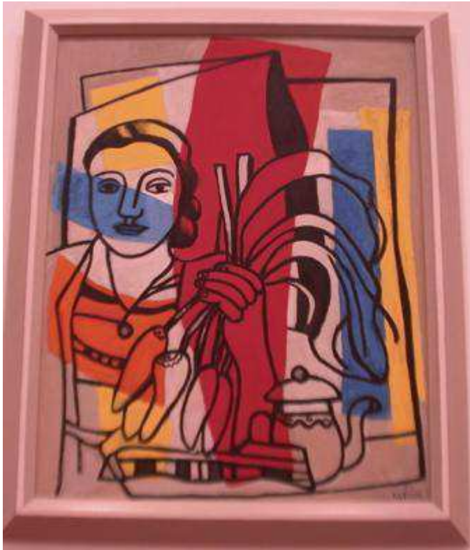
F. Léger; 1951

connaître le contexte historique et social ou culturel dans lequel l'œuvre est créée. - Un artiste peut utiliser des symboles qu'il faut interpréter.