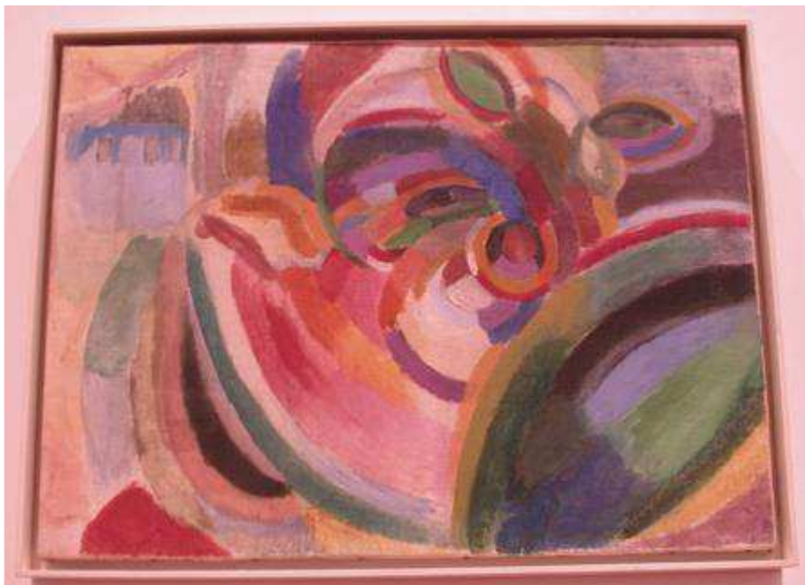
S. Delaunay : 1915 jeune fille aux pastèques. Musée des Beaux Arts de Lyon

Se définit comme artistique toute activité qui cherche à travers des images à communiquer des sensations, des émotions des sentiments. L'artiste est celui qui cherche à donner une dimension esthétique à son travail.